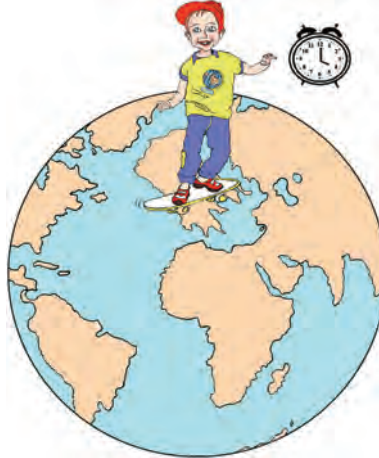
Εικόνα 1.2β: Η ώρα είναι 4:00 μ.μ.