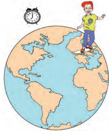
Εικόνα 1.2γ: Η ώρα είναι 7:00 μ.μ.

Η περιφορά της Γης γύρω από τον Ήλιο διαρκεί 365 ημέρες και 6 ώρες, δηλαδή 1 έτος και 6 ώρες.