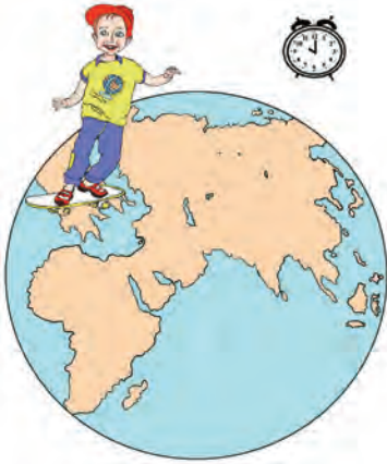
Εικόνα 1.2α: Η ώρα είναι 10:00 π.μ.

Η Γη κινείται επίσης και γύρω από τον Ήλιο. Η κίνησή της αυτή λέγεται περιφορά .